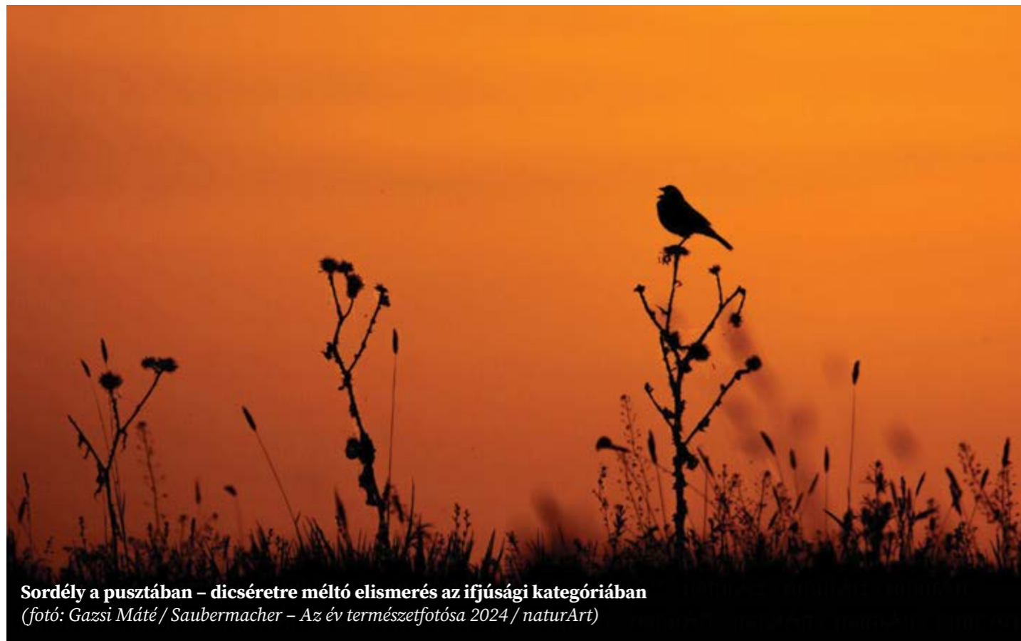
Sordély a pusztában – dicséretre méltó elismerés az ifjúsági kategóriában