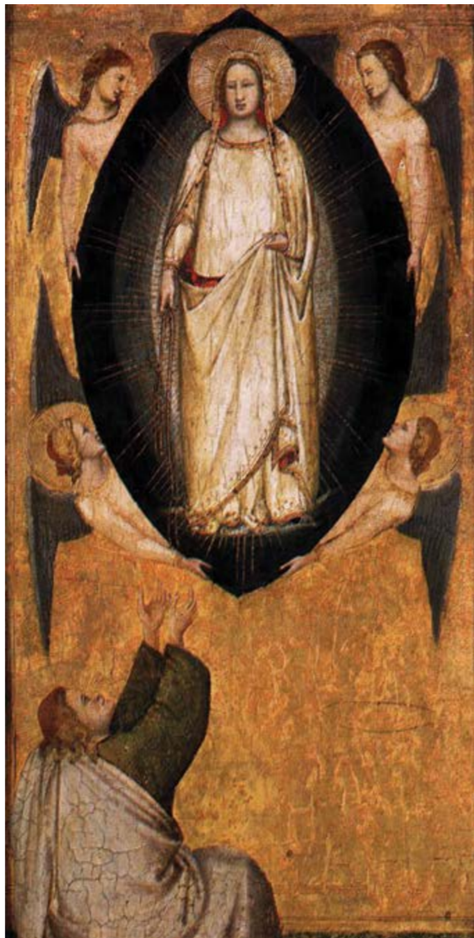
Mária övének leeresztése Tamás apostolhoz – Maso di Banco olasz festőművész festménye (1337–1339, berlini múzeum)

Baboss Botond katolikus lelképítési munkatárs