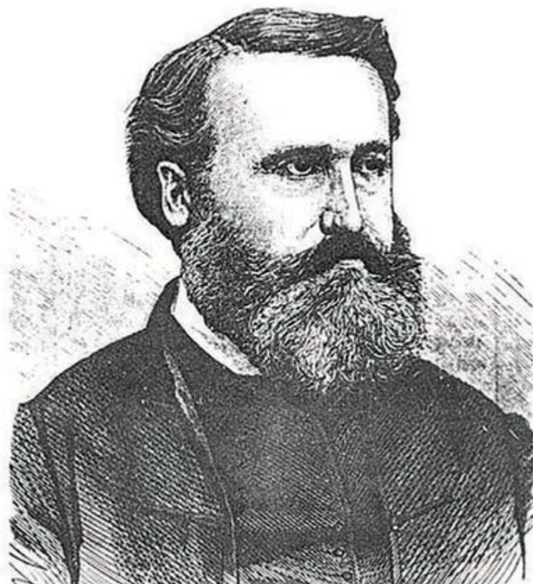
Salamon Lajos, a váli körzet országgyűlési képviselője, 1848

Június első heteiben az emberek érdeklődését és hangulatát az EU-s parlamenti és az önkormányzati választások határozták meg. Nem volt ez más-ként 1848 júniusában sem a forradalmat követő első országgyűlési választáson.